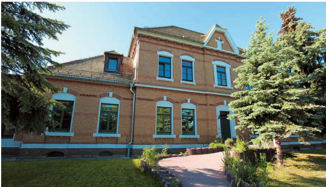
Teilansicht eines Mehrfamilienhauses in der Stadt Borna bei Leipzig mit 18 Wohnungen, verteilt auf drei Wohngebäudeteile, mit insgesamt 1.282 m 2 Fläche.